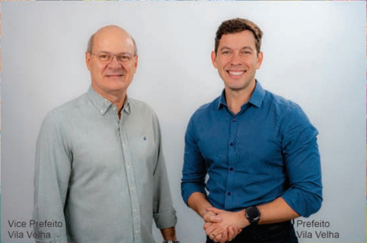
Vice Prefeito Vila Velha