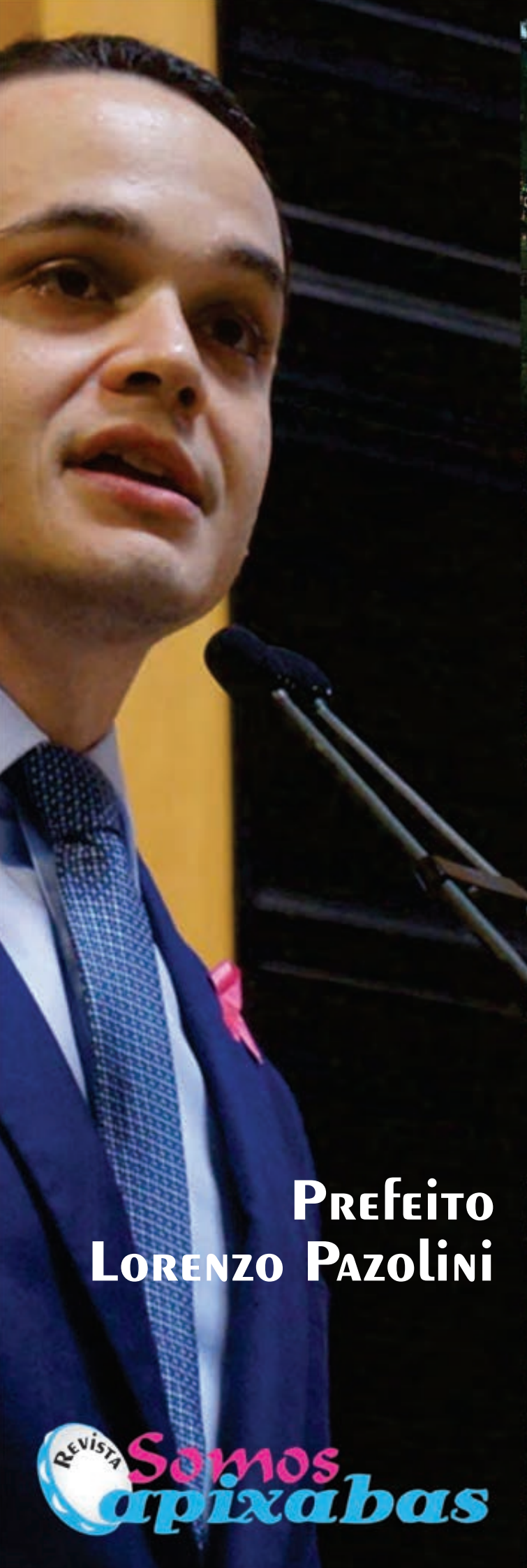
PREFEITO LORENZO PAZOLINI